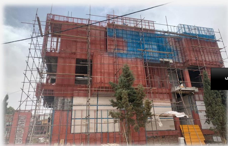
اجرای نمای ساختمان مسکونی

نمونه عکس های مربوط به عملیات عمرانی پروژه های ساختمان سازی شرکت پتک راه کویر