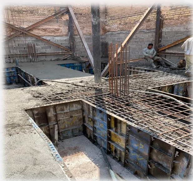
اجرای فونداسیون ساختمان مسکونی