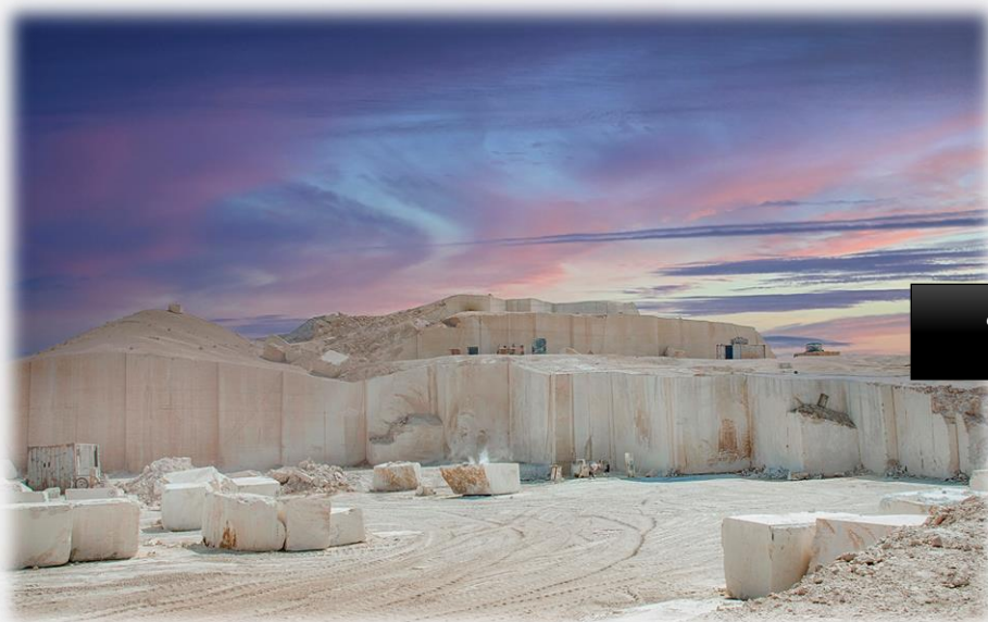
سینه کار معدن مرمریت

نمونه عکس های مربوط به معادن شرکت پتک راه کویر