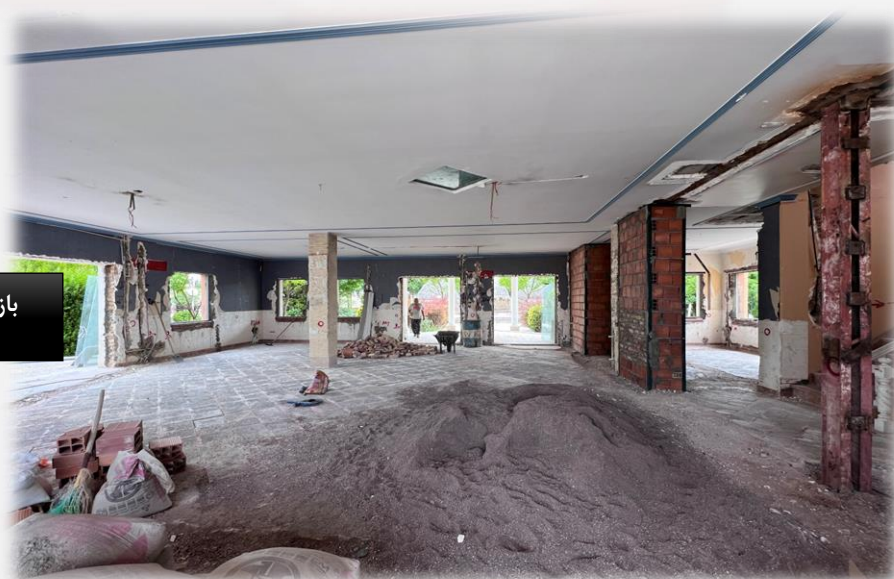
بازسازی مجتمع اقامتی هفت باغ