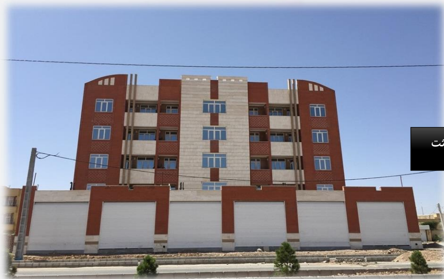
مجتمع مسکونی مدیران بعثت

نمونه عکس های مربوط به پروژه های ساختمان سازی شرکت پتک راه کویر