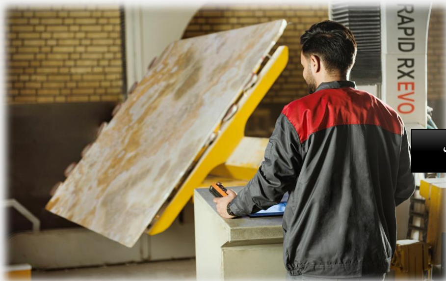
فراوری اسلب مرمر نباتی

نمونه عکس های مربوط به معادن شرکت پتک راه کویر