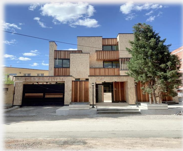
ساختمان مسکونی بلوار جمهوری