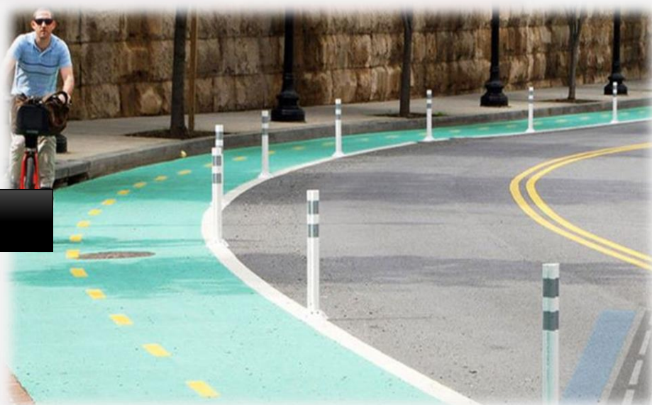
اجرای آسفالت رنگی