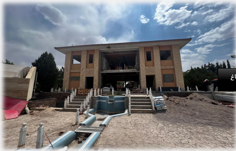
بازسازی مجموعه اقامتی هفت باغ

نمونه عکس های مربوط به پروژه های ساختمان سازی شرکت پتک راه کویر