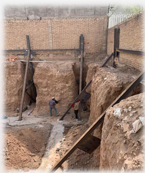
اجرای سازه نگهبان پروژه مسکونی

نمونه عکس های مربوط به عملیات عمرانی پروژه های ساختمان سازی شرکت پتک راه کویر