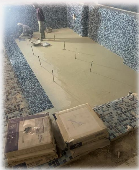
اجرای کاشی کف استخر مجتمع مسکونی