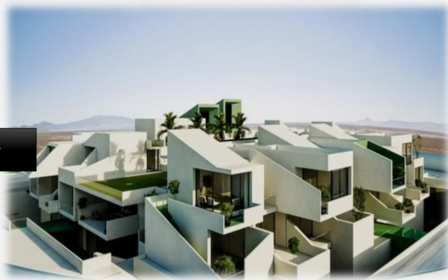
پروژه هتل در هفت باغ