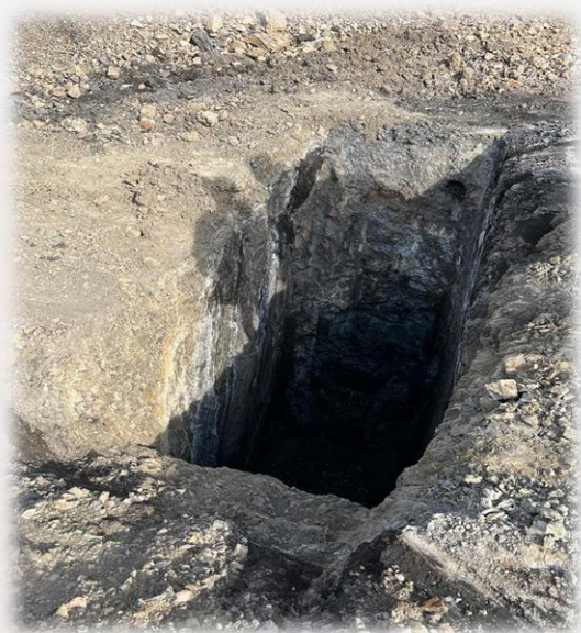
معادن زغال سنگ

نمونه عکس های مربوط به معادن شرکت پتک راه کویر