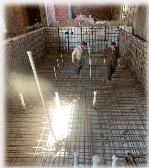
اجرای فونداسیون استخر مجتمع مسکونی

نمونه عکس های مربوط به عملیات عمرانی پروژه های ساختمان سازی شرکت پتک راه کویر