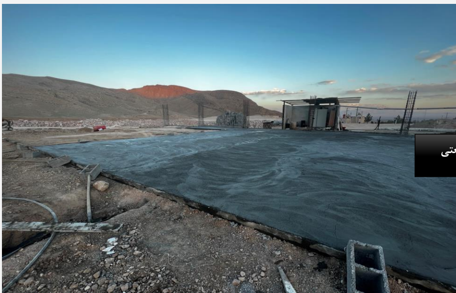
اجرای فونداسیون سوله صنعتی

نمونه عکس های مربوط به عملیات عمرانی پروژه های ساختمان سازی شرکت پتک راه کویر