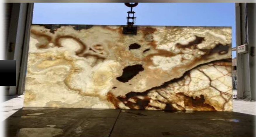
اسلب مرمر نباتی