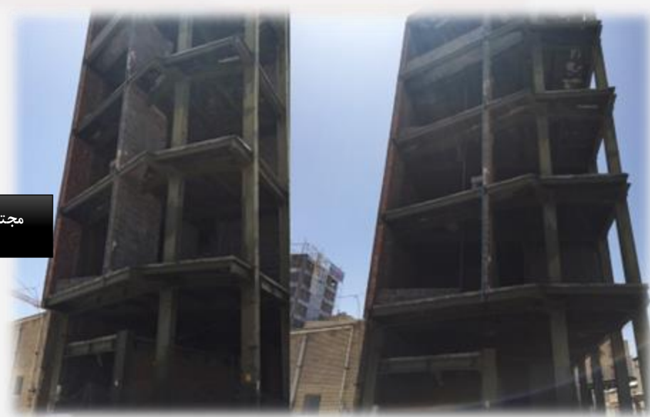
مجتمع تجاری و اداری بهمنیار