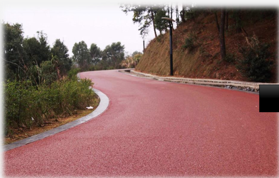
اجرای آسفالت رنگی

نمونه عکس های مربوط به عملیات تخصصی راه سازی