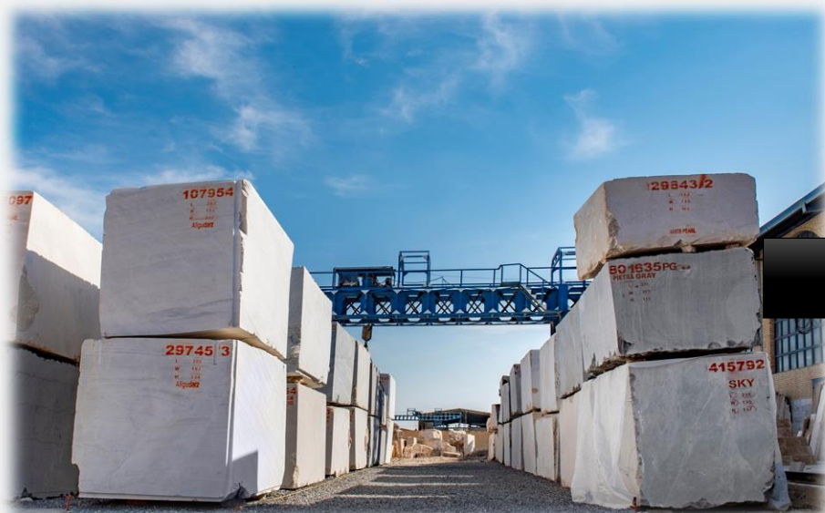
انبار دیوی کوپ ها

نمونه عکس های مربوط به معادن شرکت پتک راه کویر