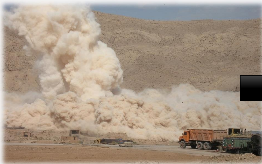
حفاری و آتشیاری

نمونه عکس های مربوط به عملیات تخصصی راه سازی