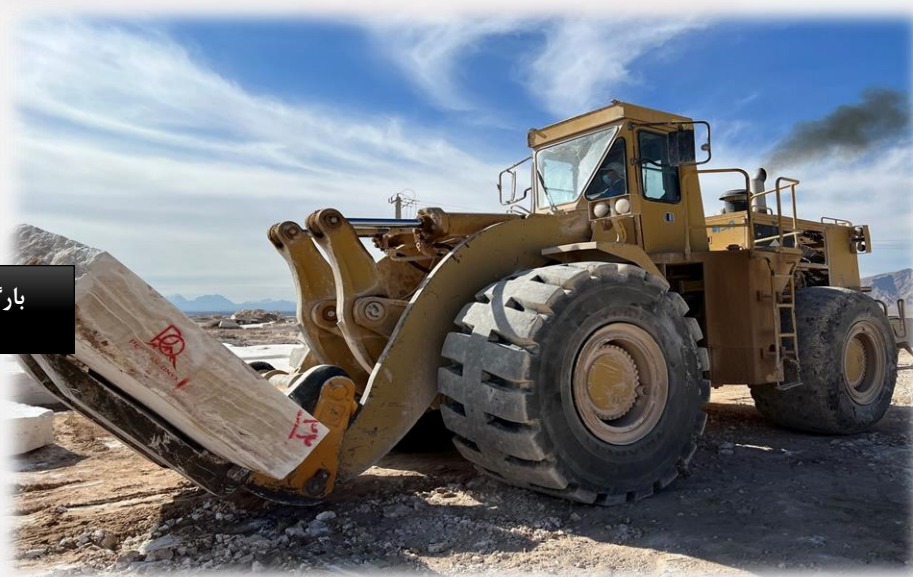
بارگیری کوپ مرمر صادراتی