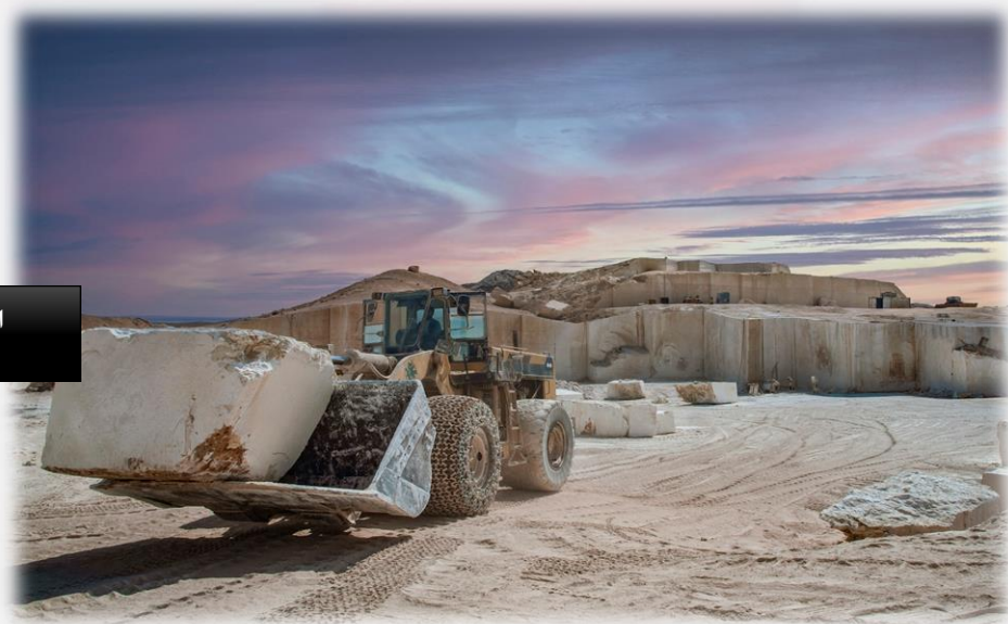
استخراج کوپ مرمریت