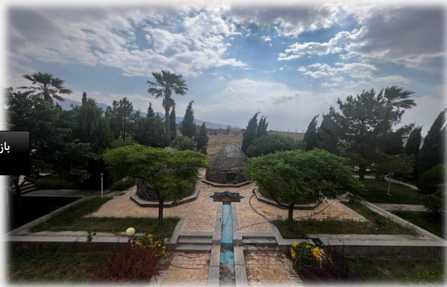
بازسازی مجموعه اقامتی هفت باغ