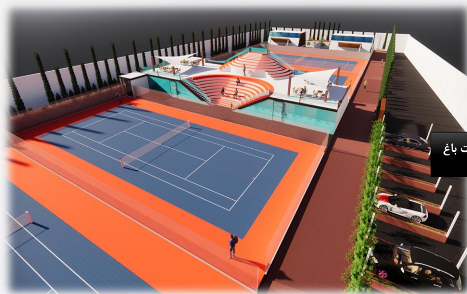
مجموعه ورزشی تفریحی هفت باغ

نمونه عکس های مربوط به پروژه های ساختمان سازی شرکت پتک راه کویر