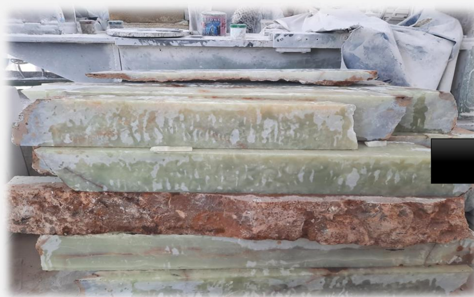
شمش مرمر سبز

نمونه عکس های مربوط به معادن شرکت پتک راه کویر