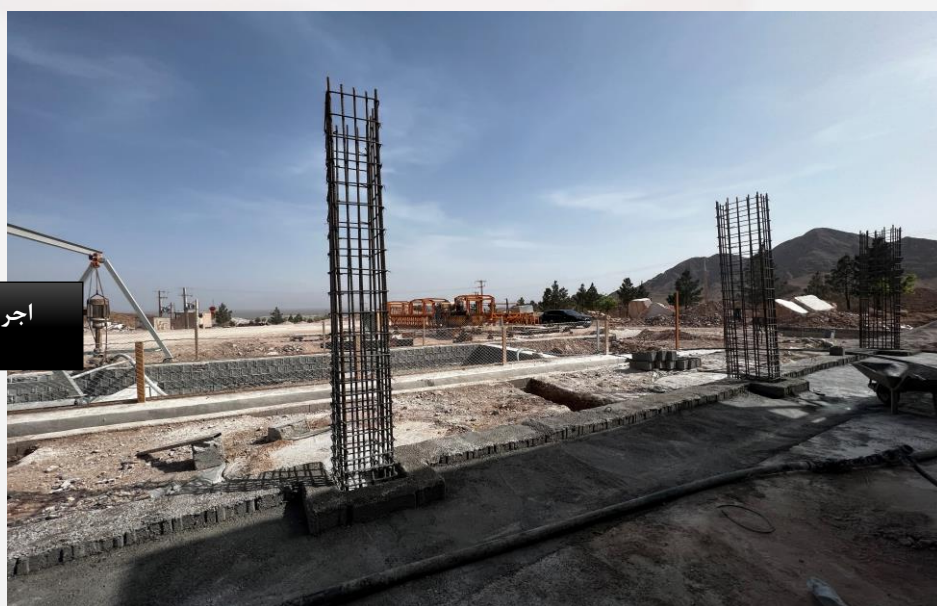
اجرای ستون های سوله صنعتی