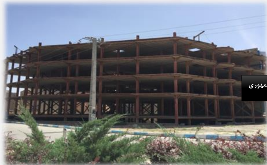
مجتمع تجاری واقع در بلوار جمهوری

نمونه عکس های مربوط به پروژه های ساختمان سازی شرکت پتک راه کویر