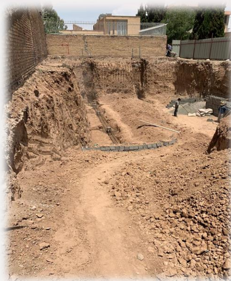
گودبرداری پروژه مسکونی