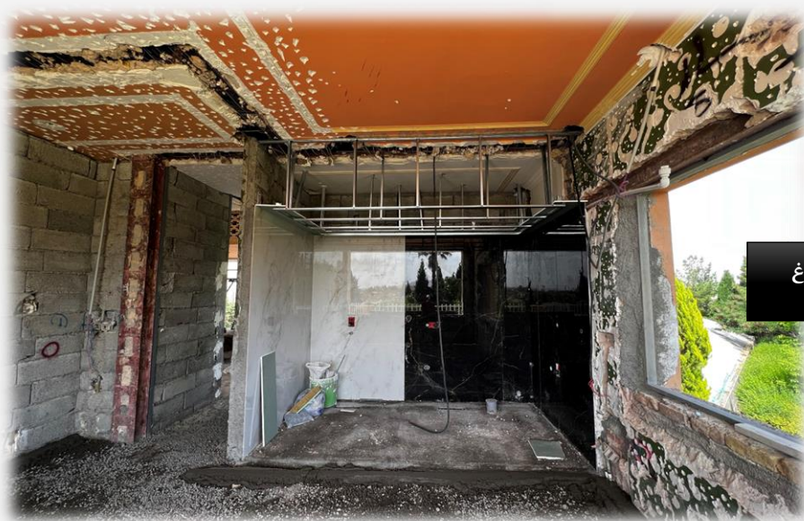
بازسازی مجتمع اقامتی هفت باغ

نمونه عکس های مربوط به عملیات عمرانی پروژه های ساختمان سازی شرکت پتک راه کویر