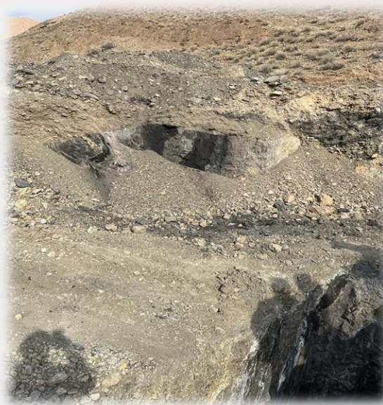
معادن زغال سنگ