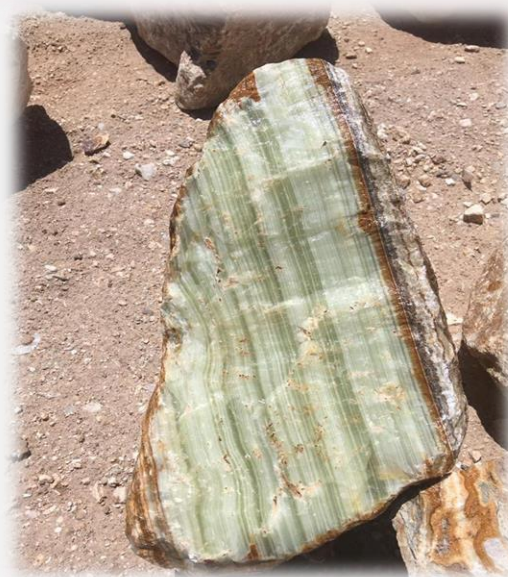
لاشه سنگ مرمر سبز